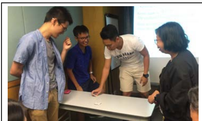
參加者把韓國當地傳統遊戲帶回香港，與來賓一同玩樂。