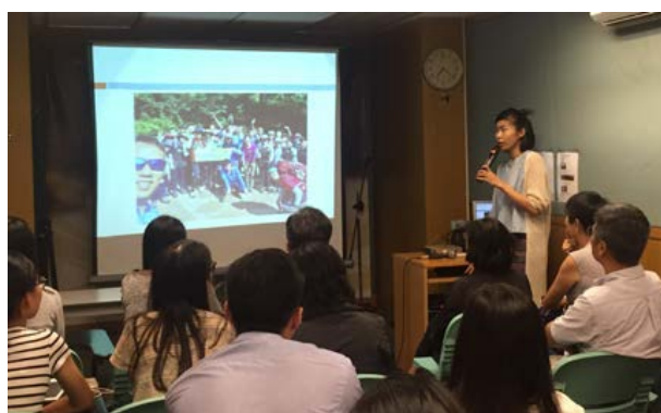
參加者介紹韓國遠足活動。