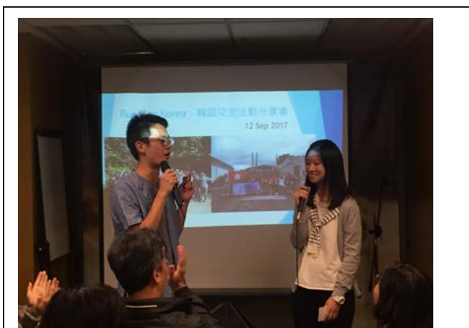
分享會由 2 位分別參加不同科目的參加者擔任司儀，為活動揭開序幕。

參加者順利於活動後回到香港，當然要與我們分享他們的所見所聞。各參加者、帶隊導師及獎勵計劃領袖於 2017 年 9 月 12 日出席了 Running Korea-韓國交流活動分享會。雖然參加者們都是前往韓國參與活動，但他們的體會卻截然不同。參加者互相分享他們所見的韓國，所認識的韓國朋友，所體會的韓國文化，讓未能出席活動的我們都彷彿跟他們去了一趟韓國。