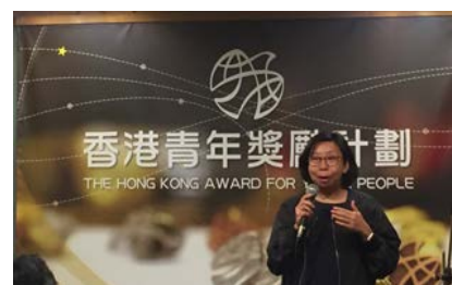
活動的尾聲，AYP 總幹事勉勵各參加者。