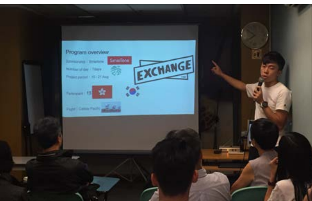
參加者分享與韓國朋友的文化交流活動。