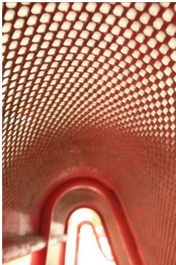
以單鏡反光相機拍攝的作品：我看見的椅子